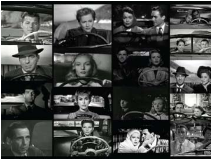
Actos de Voluntad , 2007 Exposición La puta de nuestras conciencias (en colaboración con Maj Britt Jensen) Vista de la instalación en la Sala de Arte Público Siqueiros