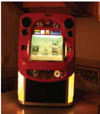
Lana y Leda. La doncella de la doble flor , 2004 Video 7' 02''