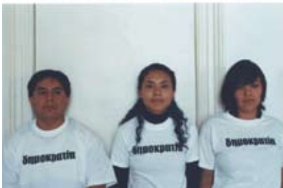
1984/Derroche y explosión, 2008-2009 Maqueta, caja de luz, video, monitor, ladrillos, documentos, serigrafías Vista de la instalación