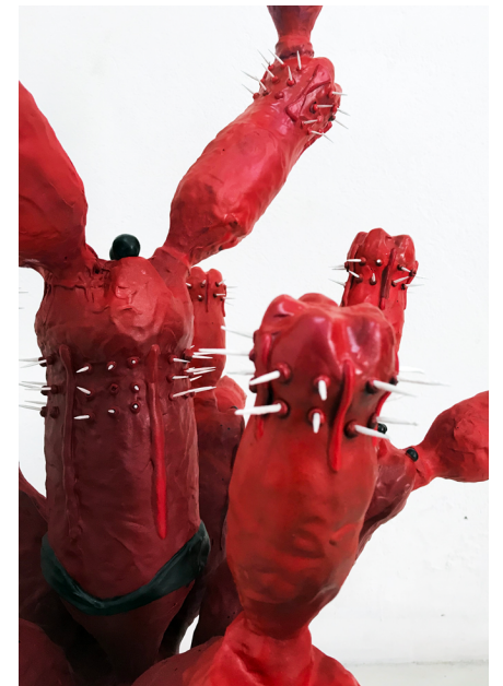
Cactáceas gaseosas del valle encantado , 2021 Botellas de Coca-Cola, goma EVA y acrílico Medidas variables