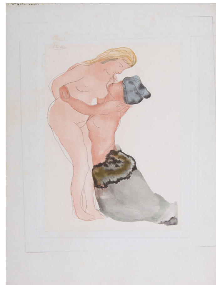
AUGUSTE RODIN DOS MUJERES ABRAZADAS , De la carpeta Dix Dessins choisis , 1904 Grabado al aguafuerte sobre papel Japón coloreado y realizada por Henri Boutet 47 x 35.3 cm Colección SC / INBAL / MACG