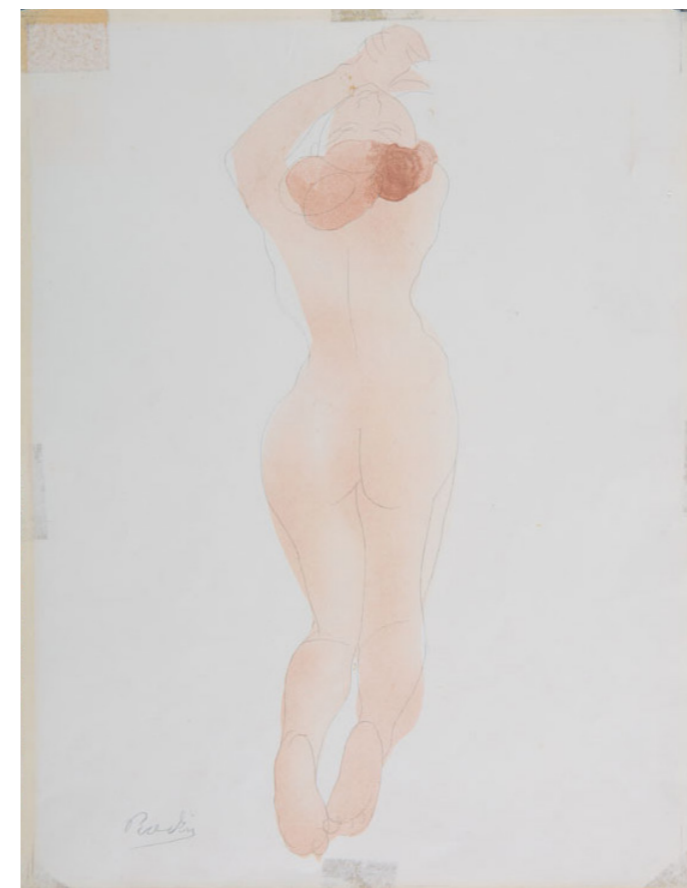
AUGUSTE RODIN ACARÍCIAME, QUERIDA , Del libro Le Jardin des Supplices de Octave Mirbeau, 1902 Litografía a color del dibujo original realizada por Auguste Clot 32 x 25 cm Colección SC / INBAL / MACG