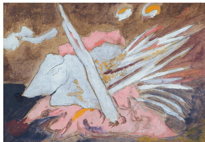
ALVAR CARRILLO GIL PAISAJE , 1952 Óleo sobre cartón 16 x 22 cm Colección SC / INBAL / MACG

Mérida buscaba una práctica artística donde la novedad y la tradición se entrelazaran y complementaran. Fueron justamente los patrones prehispánicos los que lo llevaron a experimentar con la abstracción, la forma y el color, trasladando estelas y códices a un nuevo lenguaje.