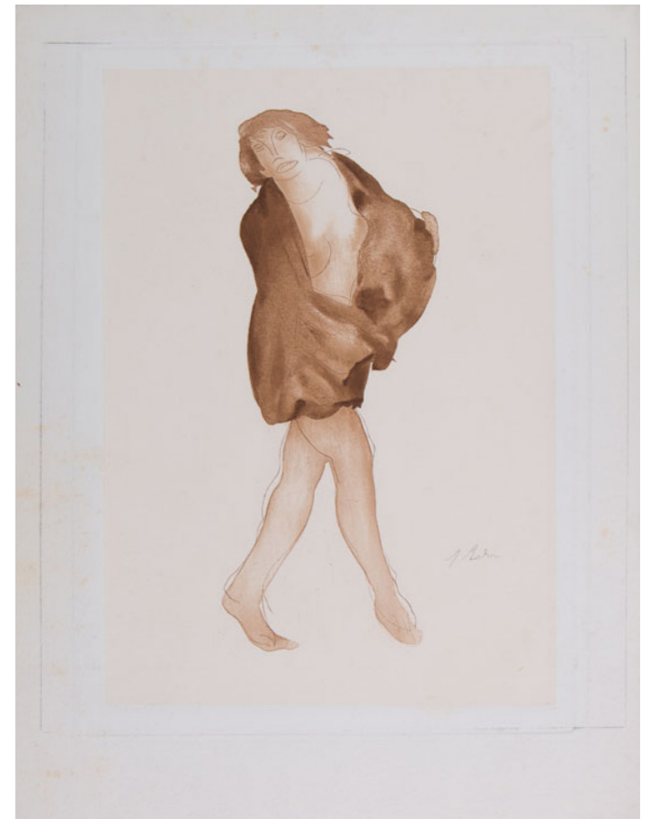
AUGUSTE RODIN MUJER BAILANDO CON MANTO , De la carpeta Dix Dessins choisis , 1904 Grabado al aguafuerte sobre papel Japón coloreado y realizado por Henri Boutet 47.6 x 35.2 cm Colección SC / INBAL / MACG