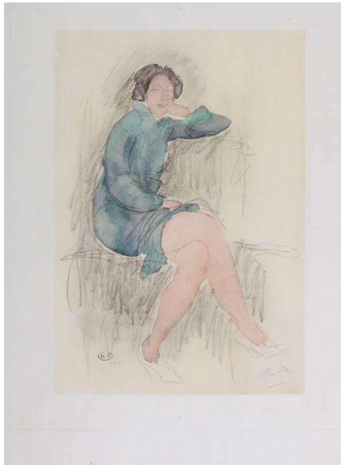
AUGUSTE RODIN MUJER SENTADA VESTIDA , s/f Grabado al aguafuerte a color 44.5 x 32.3 cm Colección SC / INBAL / MACG