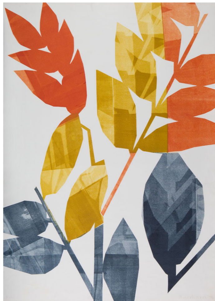
HARTWIG BURCHARD JACARANDA-CABIUNA , 1979 Monotipia 104 x 74.6 cm Colección SC / INBAL / MACG