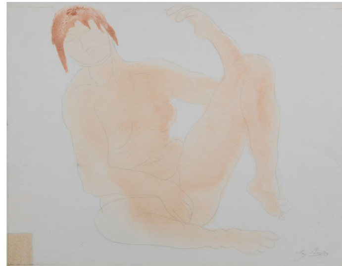
AUGUSTE RODIN POR LAS VENTANAS ILUMINADAS , s/f Litografía a color del dibujo original realizada por Auguste Clot 25 x 32.2 cm Colección SC / INBAL / MACG