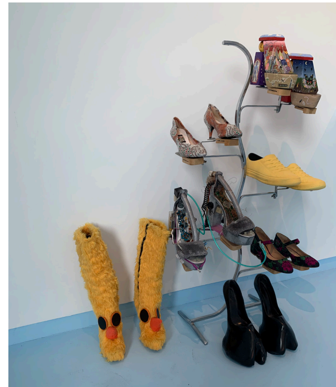
Artists's shoes, 2023

Cortina de cuentas 220 x 130 cm