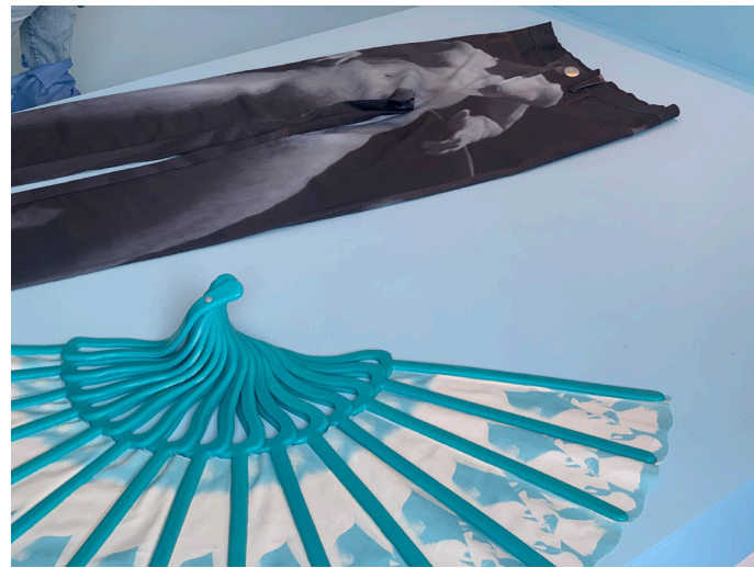
Manta de Adonis García, 2023

Pijama de satín, impresión digital sobre tela 180 x 70 cm