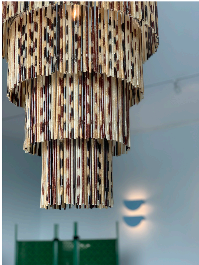
¿Qué licor impalpable brindan, alto Alcatraz, tus copas blancas?, 2023

Candelabro de resina, arroz y popotes 71 x 50 cm