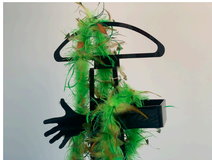
Galán de noche, 2023

Abanico de silicón blando y tela impresa 135 x 73 cm