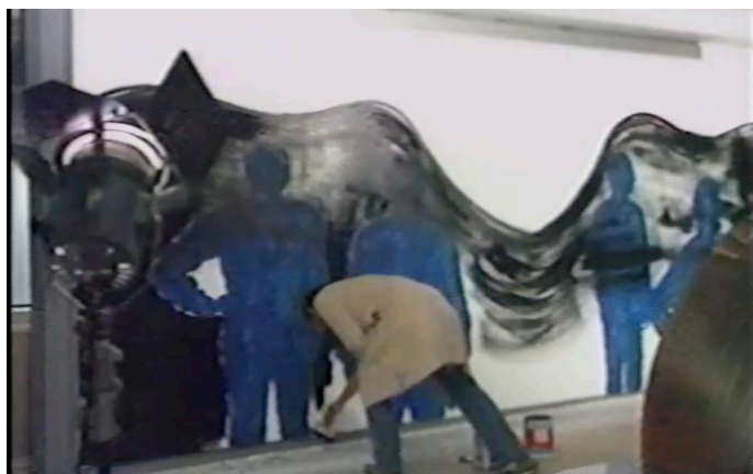
Felipe Ehrenberg. Pretérito imperfecto , MACG, noviembre de 1992