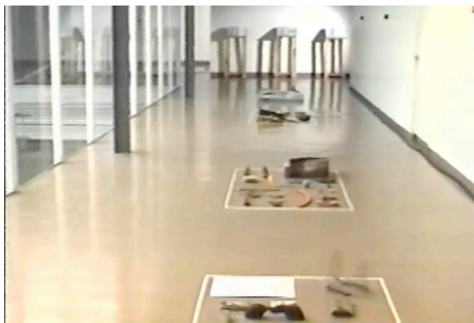
Raffael Rheinsberg. Reciclaje. La transformación de las cosas , MACG, enero de 1992